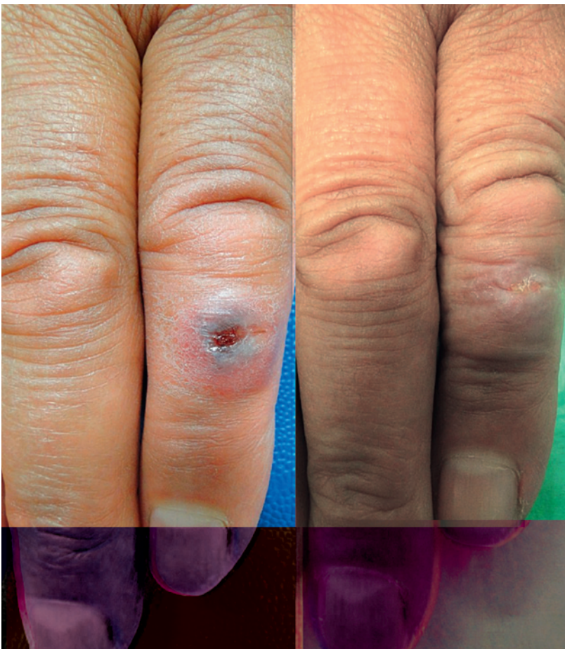
Abbildung 2: Verlauf der kutanen Läsion bei unserer Patientin zwei bzw. fünf Tage nach Therapiebeginn.

Auch in den westlichen Industrienationen ist Anthrax im letzten Jahrzehnt in den Schlagzeilen geblieben, zum einen in Zusammenhang mit einer Anthraxepidemie unter Drogenabhängigen (Heroin) in Schottland und vereinzelt Fällen in Deutschland, zum anderen aufgrund bioterroristischer Angriffe mit Milzbrandsporen in Japan im Jahr 1993 bzw. in den USA im Jahr 2001.